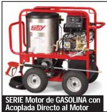
SERIE Motor de GASOLINA con Acoplada Directo al Motor