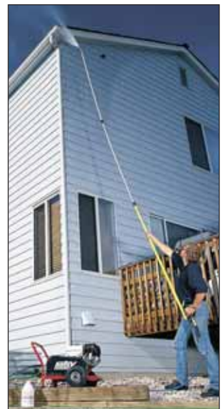
Varilla telescópica se extiende 24 pies para llegar a lugares alto sin el uso de andamios.