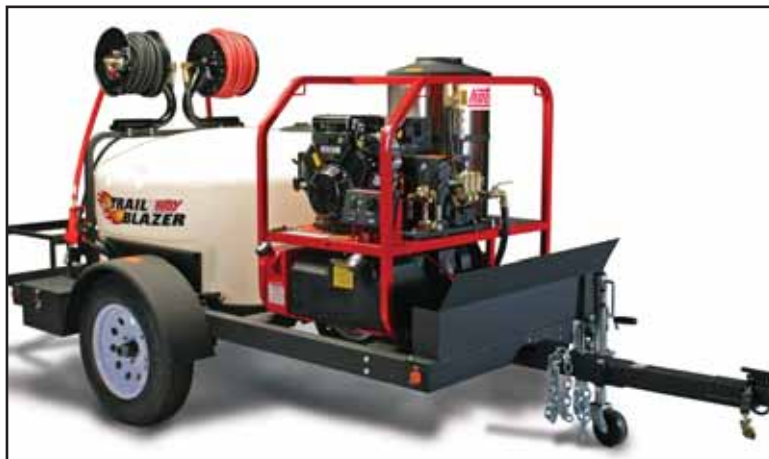
EL TRAIL BLAZER sistema de Trailer