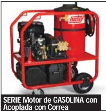
SERIE Motor de GASOLINA con Acoplada con Correa