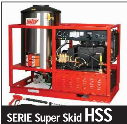
SERIE Super Skid HSS